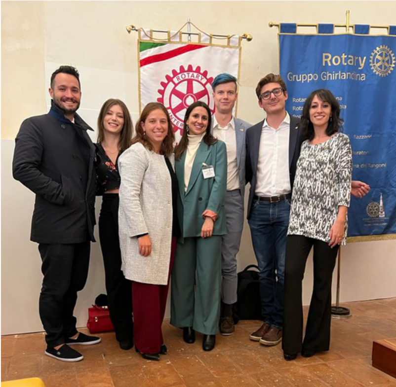
Convegno Rotary Interpaese, Modena (24 settembre)