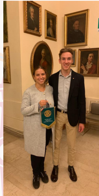
Il nostro Rotaract protegge il patrimonio artistico della nostra città: conferenza stampa Rotary padrino per il restauro delle lunette della chiesa di S. Giacomo Maggiore (29 settembre)