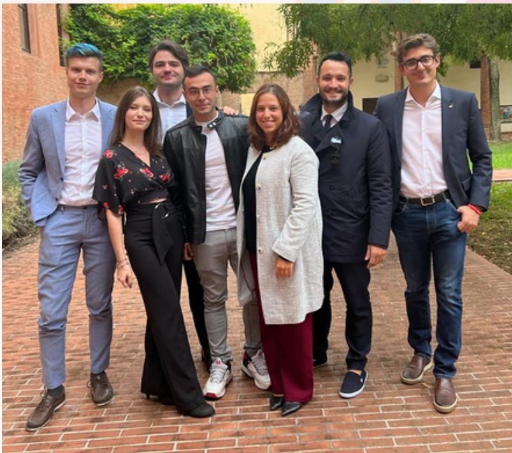
Rotaract all'opera! Lavori della seconda Assemblea Distrettuale, Modena (24 settembre)

"Il fiore che nasce dalle avversità è il più raro e il più bello di tutti"