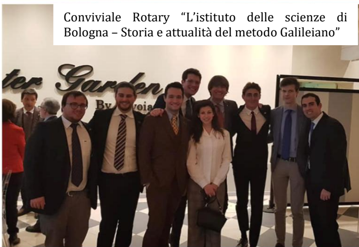
Conviviale Rotary "L'istituto delle scienze di Bologna – Storia e attualità del metodo Galileiano"