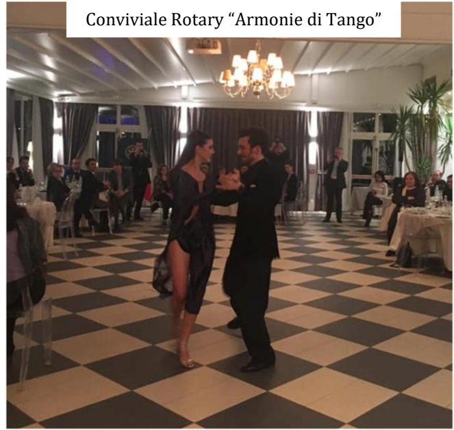
Conviviale Rotary "Armonie di Tango"