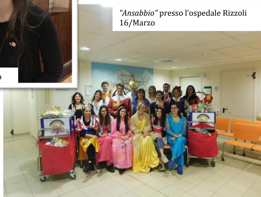
"Ansabbio" presso l'ospedale Rizzoli 16/Marzo