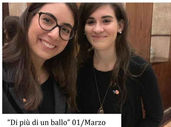
"Di più di un ballo" 01/Marzo

Ecco qualche scatto delle nostre attività!